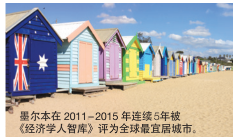
墨尔本在 2011-2015 年连续 5 年被《经济学人智库》评为全球最宜居城市。